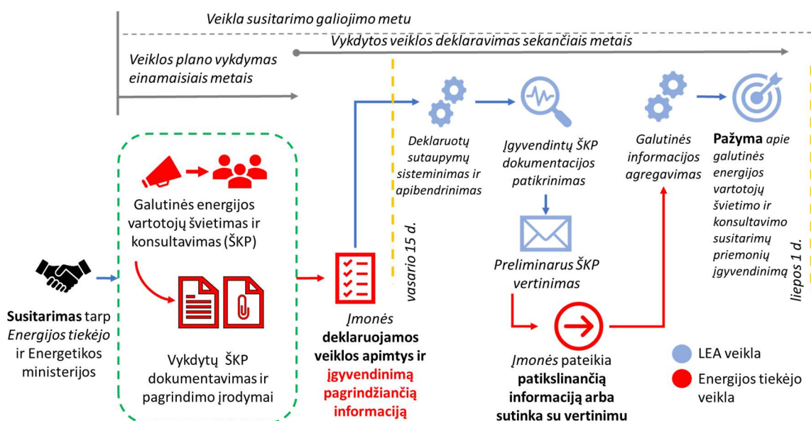
1 pav. Susitarimų įgyvendinimo ir kontrolės schema

Principinė susitarimų įgyvendinimo ir kontrolės schema pateikta 1 paveiksle.